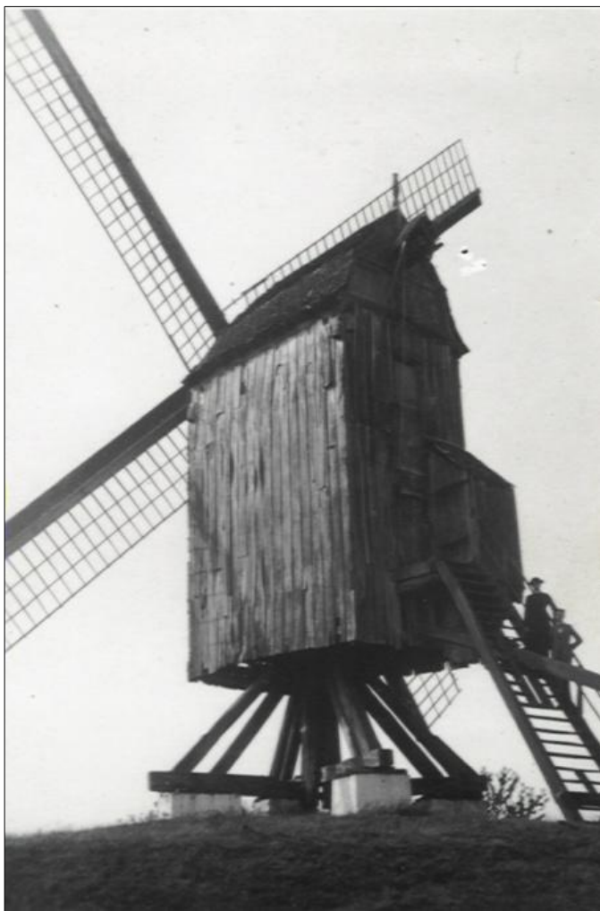
Poesele molen in 1945.