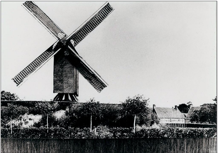
De molen van Oudegoede te Lotenhulle.

OVER DE MOLENAARSFAMILIE VAN DE VOORDE 't zit in de familie